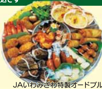
JAいわみざわ特製オードブル