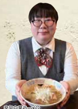
辛口白菜ラーメン

このお店のオススメは「辛口白菜ラーメン」(810円税込)。鶏ガラベースに煮干しを利かせたあっさり味のスープは、ハクサイの旨味を引き出しています。さらに、自家製のトウガラシを使用することで程よい辛さを感じ、より深い味わいに。少しでも地元野菜を使用したいというオーナーの思いから、時期によってハクサイや長ネギなどの野菜は地元産を使用しています!